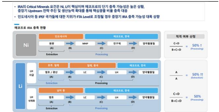
[그림1] 원소재 확보 전략을 통해 IRA 광물 요건 충분히 충족