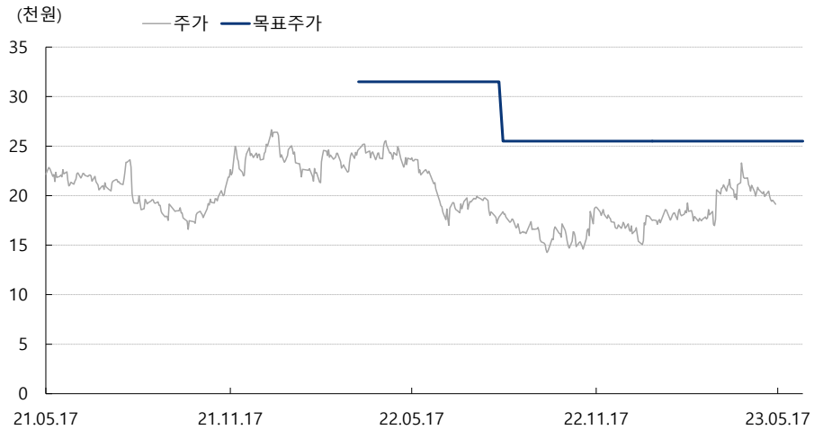
피에스케이 최근 2년간 목표주가 변동추이