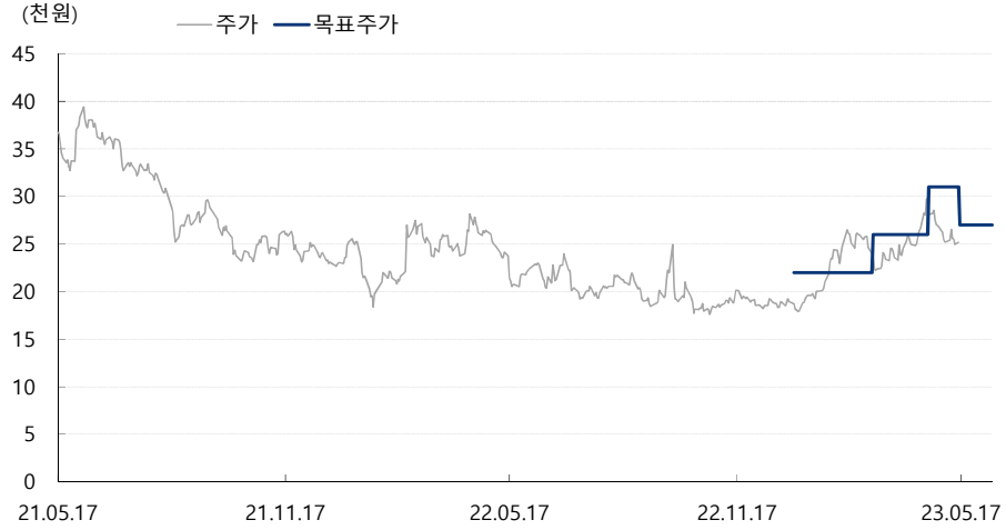
대우조선해양 최근 2년간 목표주가 변동추이