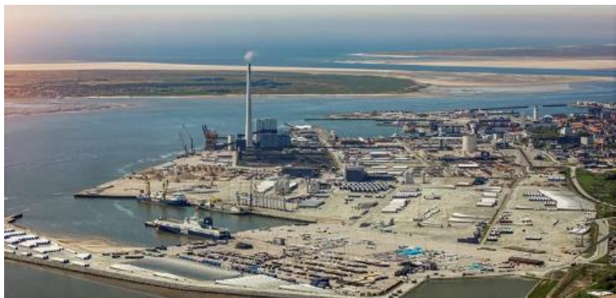
도표 7. Bladt Industries 의 덴마크 Esbjerg 생산공장 전경