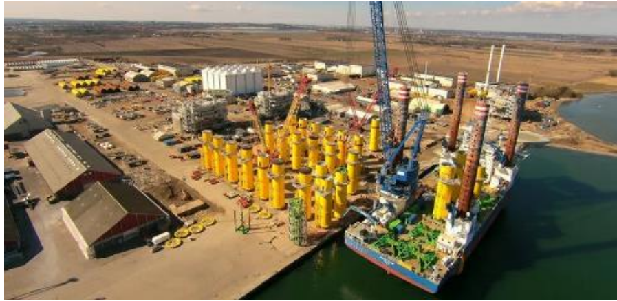
도표 5. Bladt Industries 의 덴마크 Aalborg 본사와 생산공장 전경