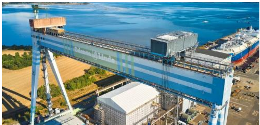
도표 6. Bladt Industries 의 덴마크 Lindo 생산공장 전경