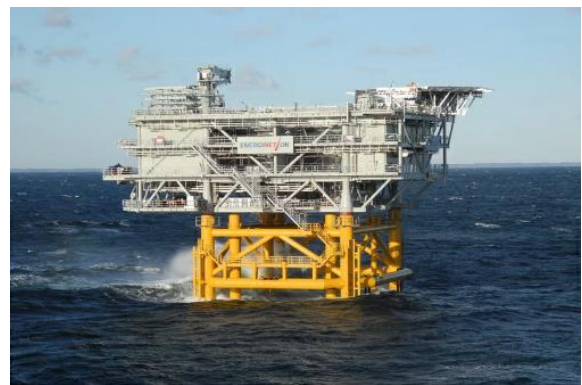
자료: Bladt Industries, 유진투자증권