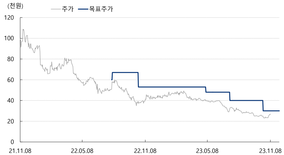
카카오게임즈 최근 2년간 목표주가 변동추이