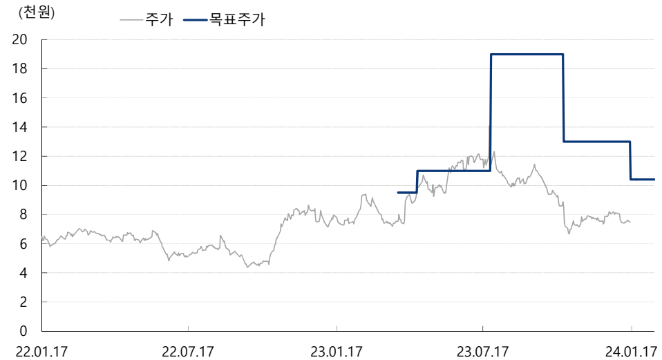
최근 2 년간 목표주가 및 괴리율 추이